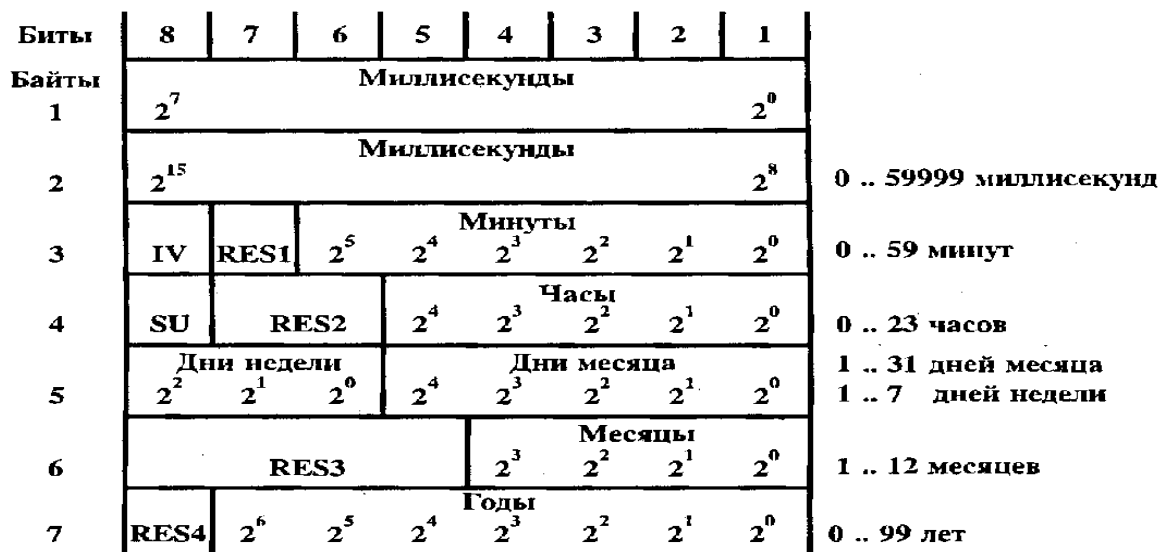
Рисунок 3 – Структура элемента информации CP56Время2а

Идентификатор типа <103> используется для записи в таймер преобразователя семь байт текущего времени в двоичном коде. Структура элемента информации CP56Время2а приведена на рисунке 3.