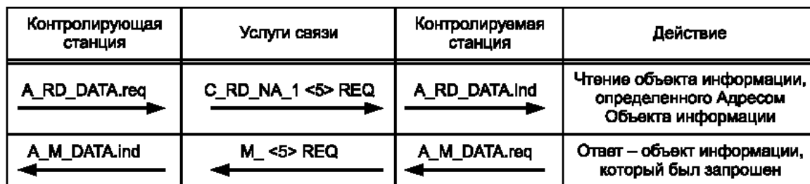
Рисунок 2 – Последовательная процедура — процедура чтения

REQ (ASDU 102), содержащий адрес объекта информации, который определяет запрошенный объект информации.