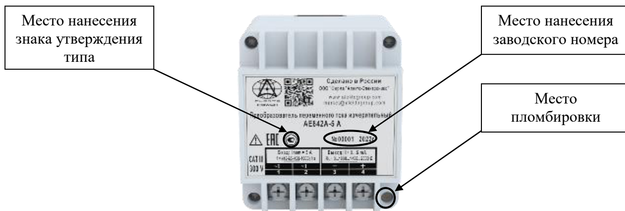
Рисунок 1 – Общий вид преобразователей АЕ842А, АЕ842С с номинальным током до 5 А и указанием места пломбировки, мест нанесения заводского номера и знака утверждения типа