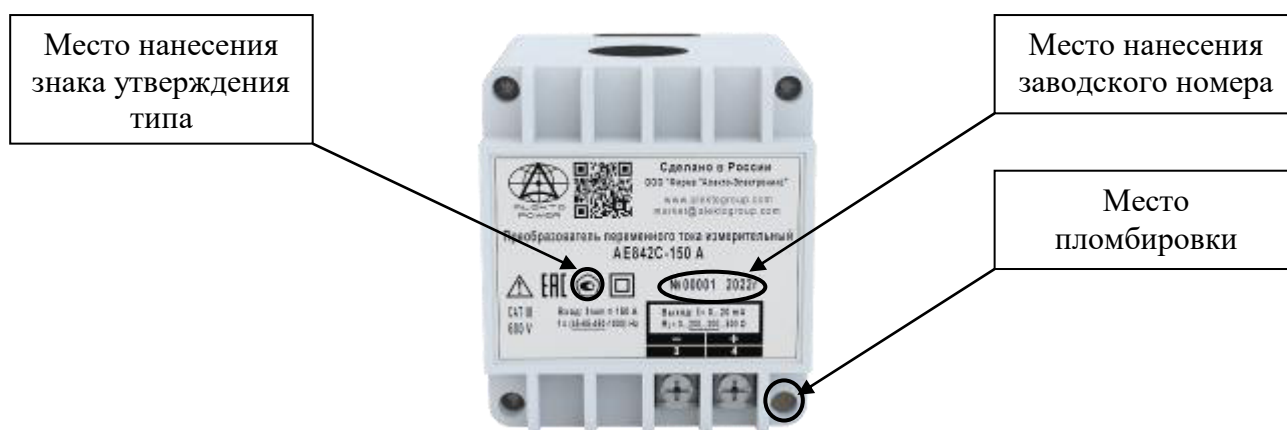
Рисунок 2 – Общий вид преобразователей АЕ842С с номинальным током свыше 5 А и указанием места пломбировки, мест нанесения заводского номера и знака утверждения типа